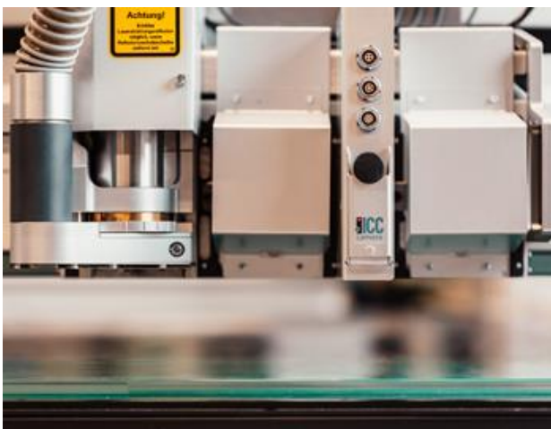
Bild 2: Ein integriertes Kameramodul ermöglicht hochpräzises Laserschneiden

„Der Vergleich verschiedener Hersteller führte uns sehr schnell nach Lüneburg zu Eurolaser. Letztendlich hat uns das „GESAMTKONZEPT EUROLASER“ überzeugt, beginnend von der Software, die komplett in unsere Shop-Automatisierung mit Barcode eingebunden werden konnte, über die Laufruhe und Performance der Maschine, der exakte, saubere Laserschnitt und natürlich die auf unser System abgestimmte Absauganlage der Firma ULT“, erklärt der Geschäftsführer.