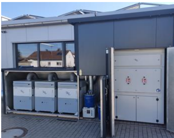
Bild 3: Absauganlagen LAS 2000 (rechts) und ACD 1200 – geschützt vor Witterungseinflüssen

Dies führte zu einem zeitaufwändigen Auswahlprozess. Die Anbieter benötigten umfangreiche Informationen, um eine passende Anlage zu konfigurieren. Das größte Problem stellte jedoch die Geruchsvermeidung im Freien dar. Durch die Remote-Option in der Laserschneidanlage war auch die „richtige Ansteuerung“ der verschiedenen Absperrschieber und der Absaugsteuerung nicht zu unterschätzen. „Da nur die perfekte Absaugung direkt am Laserschnitt zu einem perfekten Laserergebnis führt, haben wir uns nicht für die günstigste, sondern für die aus unserer Sicht beste Lösung entschieden. Die Kombination aus den Anlagen von Eurolaser und ULT“, erklärt Daniel Carmagnani.