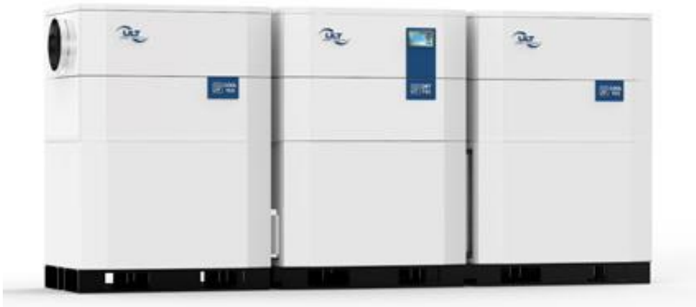
Bild 4: Modulkonzept ULT Dry-Tec®, eines von vielzähligen Möglichkeiten

Eine seit kurzem verfügbare Lösung für extrem trockene Umgebungsluft stellt das System ULT Dry-Tec® der ULT AG dar. Das neuartige modulare Systemkonzept ermöglicht das Erreichen von Taupunkttemperaturen bis zu -65\text{ °C} ( T_p ).