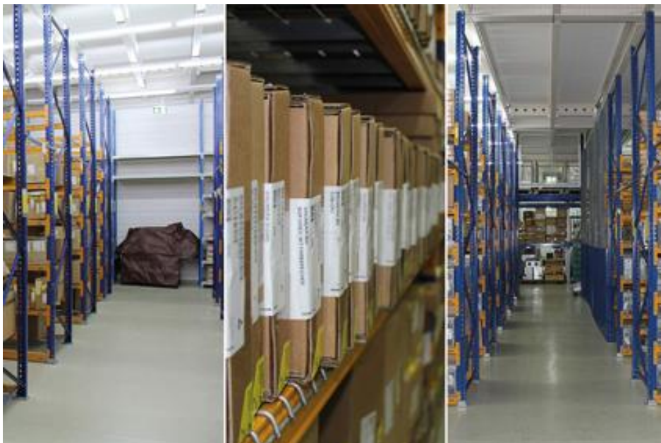
Bild 2: Lagerung elektronischer Baugruppen – Oxidation unerwünscht

Die Luftfeuchtigkeit bedingt ebenfalls die Diffusion: Das Eindringen von Wasserdampf und Luftschadstoffen in die innere Struktur von Bauteilen oder -gruppen kann in diesem Fall sogar soweit führen, dass sich Leiterzüge und Isolierschichten langfristig zersetzen.