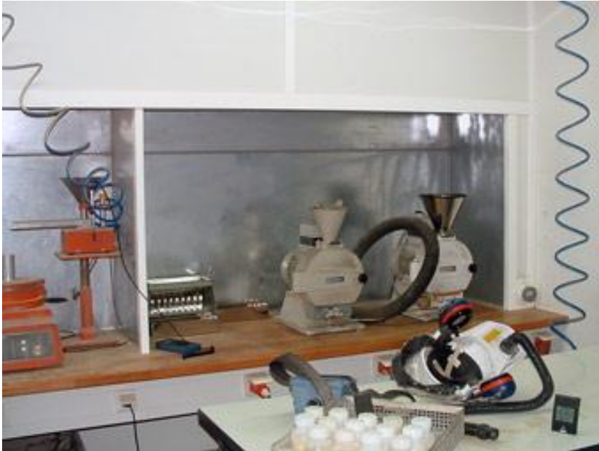
Forschungslabor eines tschechischen Unternehmens