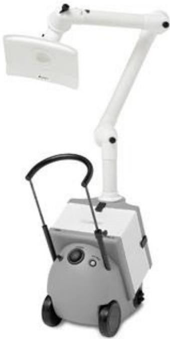
Mobiles Absauggerät JUMBO Filterrolley LabCat – leise und flexibel

geht. Filtertechnik sollte niemals als störend empfunden werden – sie darf dem Mitarbeiter in seinen täglichen Handlungen weder im Wege sein noch akustisch beeinträchtigen.