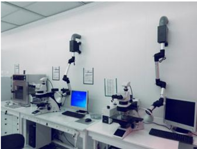
Einsatz von Absaughauben in einem französischen Labor

1. Im französischen Labor fallen eher geringe Mengen an Klebedämpfen an, die auch nicht derart giftig sind, dass sie keinesfalls in die Umgebungsluft gelangen dürfen. Zur Beseitigung der Dämpfe werden Absaughauben eingesetzt, die über Rohrleitungen mit einer zentralen Absauganlage verbunden sind.