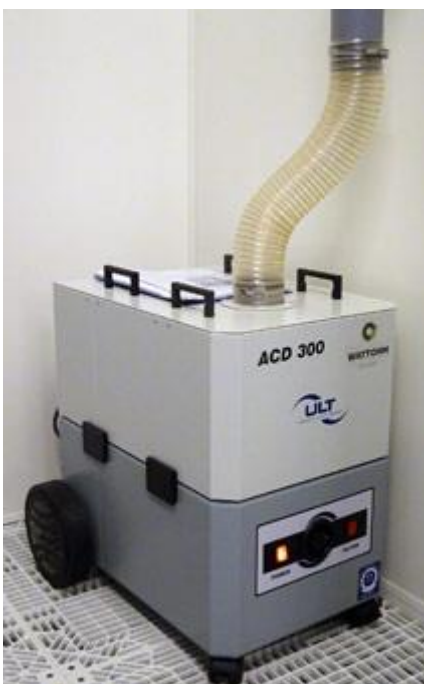
Zentrale Absauganlage für mehrere Laborarbeitsplätze