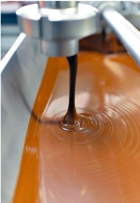
Bild 2: Schokoladenproduktion – hier muss eine niedrige Luftfeuchte herrschen

Besonders das Auskristallisieren von Zucker wird durch eine niedrige konstante Luftfeuchtigkeit gewährleistet. Daher ist trockene Prozessluft sehr vorteilhaft bei der Herstellung von Süßwaren und für die Trocknungszeit des Produktes vor der Verpackung. Schokolade, Bonbons oder auch gelatinehaltige Produkte dürfen weder an der Verpackungsoberfläche noch aneinander kleben.