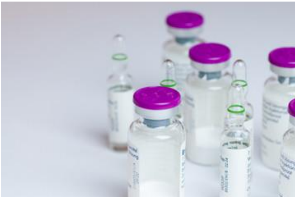
Bild 2: Ampullen und Injektionsflaschen mit pulverförmigen Wirkstoffen

Besonders kritisch sind pulverförmige Wirkstoffe, besonders wenn sie gut wasserlöslich (hydrophil) oder sogar sehr gut wasserlöslich (superhydrophil) sind. Diese Wirkstoffe verbleiben nach dem Abfüll- und Verschließprozess erst einmal „trocken“ im Behältnis und werden auf bestimmte Zeit bis zum Verbrauch eingelagert. Die mit dem pulverigen Wirkstoff gefüllten Injektions- oder Infusionsflaschen werden erst kurz vor der Injektion bzw. Infusion mit einer wässrigen Lösung (meist NaCl oder steriles Wasser) aufgefüllt. Bis dahin dürfen Sie keinerlei Feuchtigkeit aufnehmen, um ihre Wirkung zu gewährleisten.