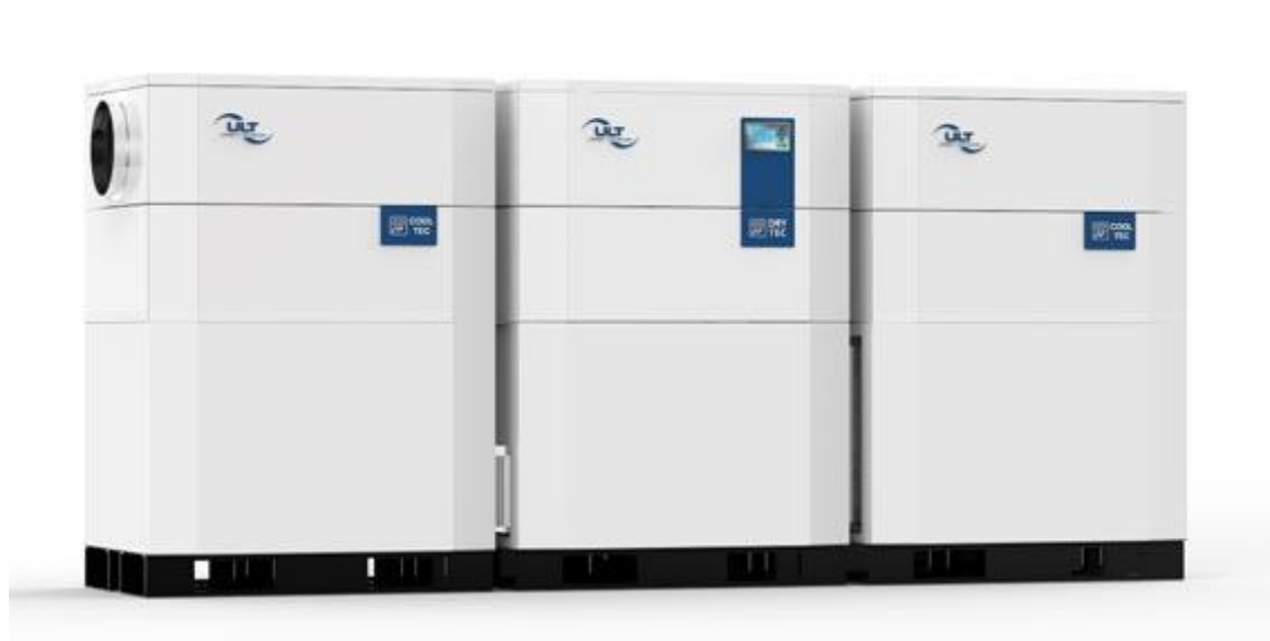
Bild 4: Modulkonzept ULT Dry-Tec® (mittig) mit Vorkühler ULT Cool-Tec® V (links) und Nachkühlermodul ULT Cool-Tec® N (rechts)

Eine seit kurzem verfügbare Lösung für extrem trockene Prozessluft stellt das System ULT Dry-Tec® der ULT AG dar. Das modulare Systemkonzept ermöglicht das Erreichen von Taupunkttemperaturen bis zu -65 \text{ °C} (Tp) bei Umluftbetrieb.