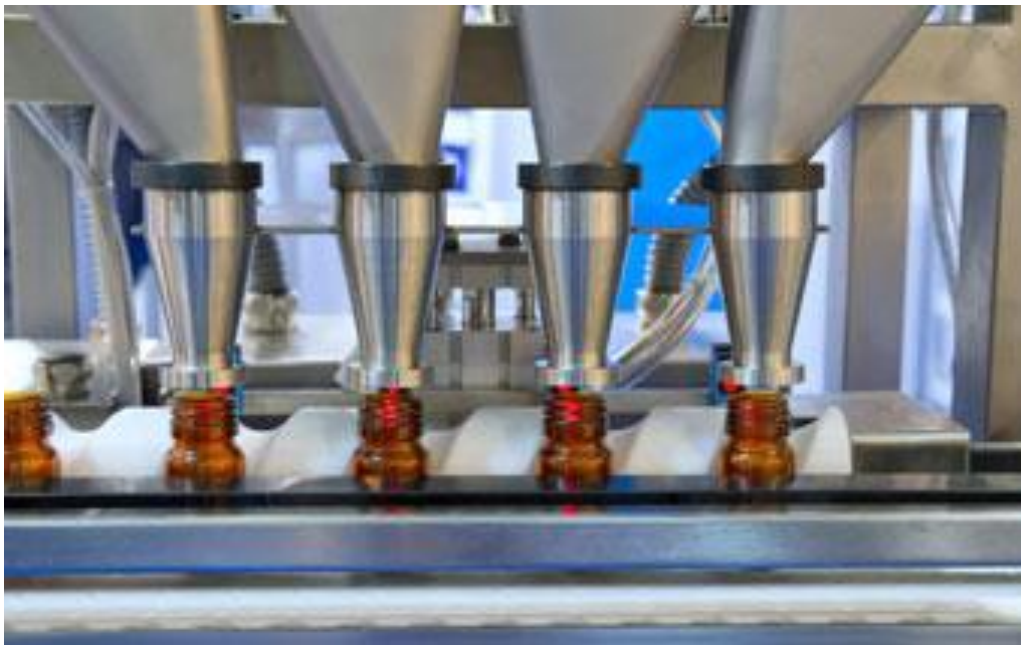
Bild 1: Anlage zum Abfüllen von Pharma- und Biopharmaprodukten

Der weltweite Markt in der Verpackungs- und Abfüllindustrie boomt seit Jahren und gehört zu den umsatzstärksten Segmenten innerhalb des deutschen Anlagen- und Maschinenbaus. Allein im Jahr 2016 lag der deutsche Inlandsumsatz in dieser Branche bei über 17 Milliarden Euro – im Auslandsgeschäft bei nahezu 25 Milliarden Euro. Dies verdeutlicht den hohen und wachsenden Bedarf an immer schneller werdenden High-Tech-Verpackungs- oder Abfüllprozesslinien in den unterschiedlichsten Bereichen. Dazu gehört auch die Pharmaindustrie inkl. der stark heranwachsenden weltweiten Bio-Pharmabranche.