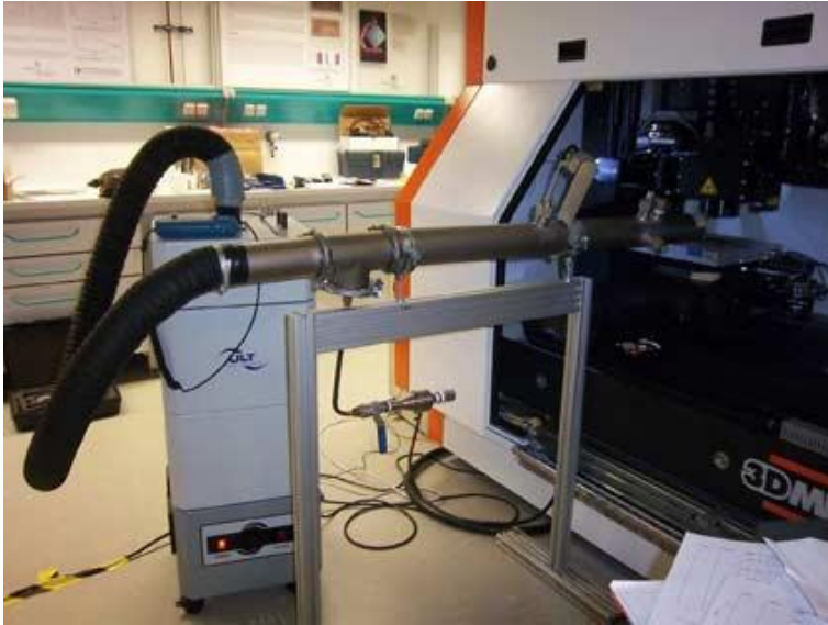
Bild 1: Messaufbau zur Charakterisierung der Partikelphase an einem UKP-Laser bestehend aus Absaugrohr, Messstrecke und dem Absauggerät LAS 200

Repetitionsrate, Laserleistung, Entfernung und Position der Erfassungseinrichtung, Abscheideleistung des Filtergerätes und der Einfluss des abgetragenen Materials waren Gegenstand der Untersuchung. Diese Parameter und deren Einfluss auf die Partikelemission bei Bearbeitung verschiedener Materialien mit dem UKP-Laser wurden genauestens unter die Lupe genommen. Dabei wurden die Einflüsse auf Partikelanzahl, -konzentration und -verteilung bestimmt. Zur Umsetzung des Untersuchungsauftrages hat das Fraunhofer Institut für Werkstoff- und Strahltechnik (IWS) zusammen mit dem Institut für Luft- und Kältetechnik (ILK) an einem Ultrakurzpulslaser einen Messaufbau aus Absaugrohr, Messstrecke und Absauggerät installiert.