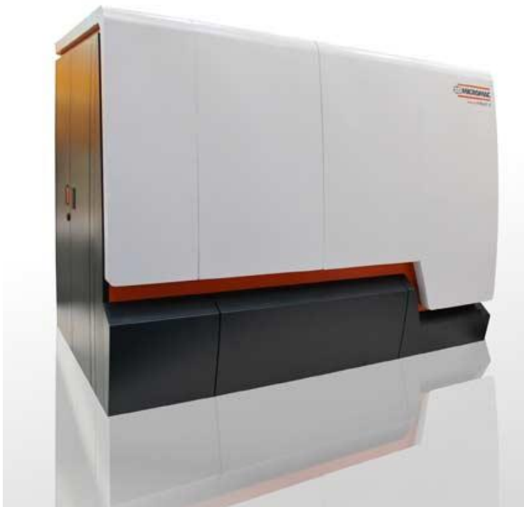
Bild 4: Anlage der Firma 3D-Micromac mit Ultrakurzpuls-Laser als Versuchsobjekt

Bei einer Repetitionsrate von 200 kHz stellte ULT bei der Bearbeitung von Edelstahl und Silizium ähnliche Konzentrationshöhen fest. Bei der Keramikbearbeitung hingegen fällt eine im Vergleich zur Edelstahlbearbeitung um 80 Prozent niedrigere Partikelkonzentration an. Bei der Bearbeitung von Edelstahl und Keramik werden Partikel eines ähnlichen Größenspektrums frei. Bei der Bearbeitung von Silizium hingegen wurden größere Partikel festgestellt. Bei einer Repetitionsrate von 4.000 kHz setzt die Keramik- beziehungsweise Siliziumbearbeitung eine ähnliche Partikelanzahl frei, während bei Edelstahl weniger Partikel entstehen.