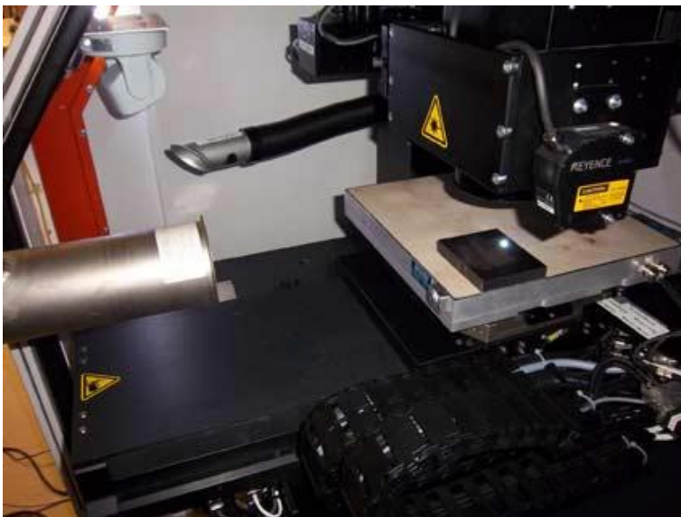
Bild 2: Im ersten Schritt wurde der Einfluss der Repetitionsrate auf die Partikelgrößenverteilung und die Anzahlkonzentration der Emissionen bei der Bearbeitung von Edelstahl untersucht.

Repetitionsrate, Laserleistung, Entfernung und Position der Erfassungseinrichtung, Abscheideleistung des Filtergerätes und der Einfluss des abgetragenen Materials waren Gegenstand der Untersuchung. Diese Parameter und deren Einfluss auf die Partikelemission bei Bearbeitung verschiedener Materialien mit dem UKP-Laser wurden genauestens unter die Lupe genommen. Dabei wurden die Einflüsse auf Partikelanzahl, -konzentration und -verteilung bestimmt. Zur Umsetzung des Untersuchungsauftrages hat das Fraunhofer Institut für Werkstoff- und Strahltechnik (IWS) zusammen mit dem Institut für Luft- und Kältetechnik (ILK) an einem Ultrakurzpulslaser einen Messaufbau aus Absaugrohr, Messstrecke und Absauggerät installiert.