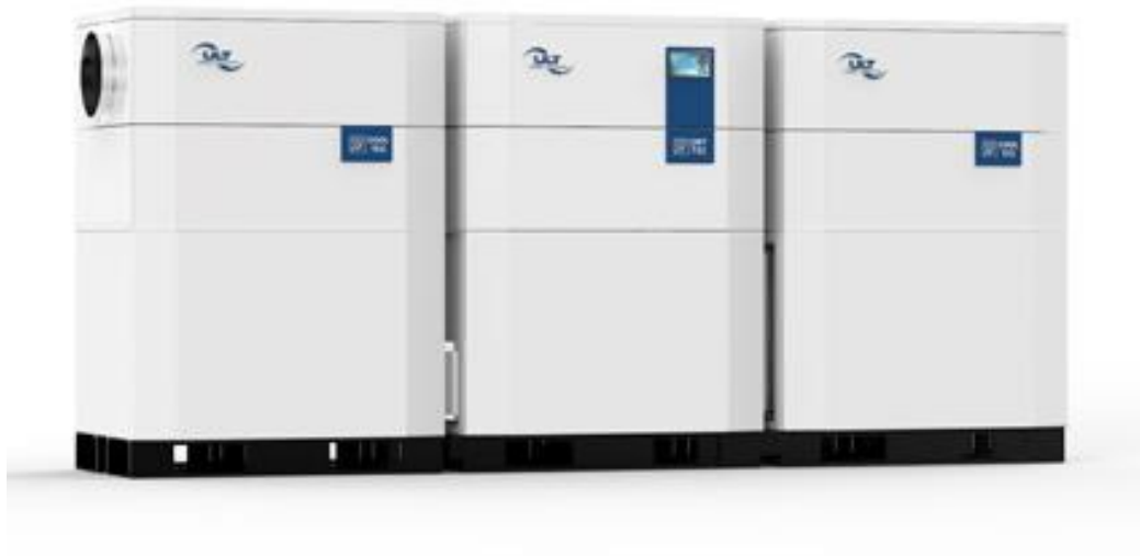
Bild: Modulares Konzept ULT Dry-Tec® mit Vor- und Nachkühlermodulen

Das ULT Dry-Tec-Modulkonzept bietet Betreibern die Möglichkeit, sich aus standardisierten Anlagenteilen eine auf die Prozessanforderungen passende Anlage zur Luftkonditionierung zusammenzustellen. Das Modulkonzept ermöglicht außerdem auch bei limitierten Platzverhältnissen eine flexible Einbringung und Aufstellung kleinerer Einzelanlagenkomponenten in bestehenden Technikräumen. Zusätzlich haben Anwender die Möglichkeit, die zahlreichen Optionen des Konzeptes zu nutzen, um sich die Anlage individuell auf ihre Bedürfnisse anzupassen. So ist beispielsweise die Einbindung und Steuerung der Anlage über die Gebäudeleittechnik vor Ort für viele verschiedene Systeme verfügbar.